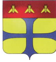
Ordine degli Avvocati di Parma